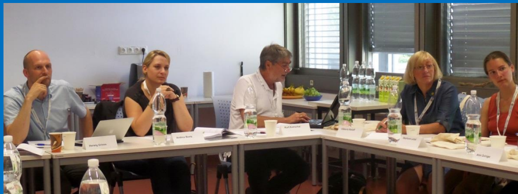
Engagierte in Diskussion.

Austausch beim gemeinsamen Heurigen Schübel-Auer, Wien – Nußdorf