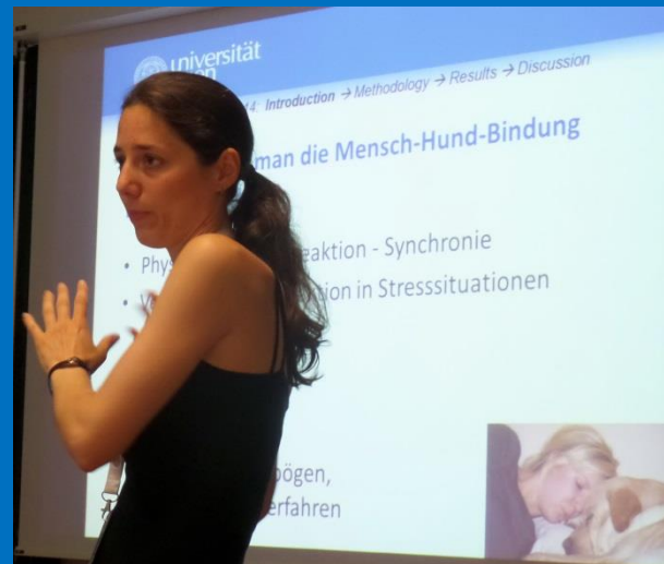
Die Physiologie der Mensch-Hund-Bindung

TU Dresden, Fakultät Erziehungswissenschaften