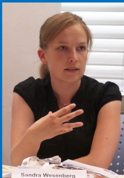
Positive Wirkungen eines tiergestützten Interventionsprogrammes auf demenziell erkrankte Pflegeheimbewohner Sandra Wesenberg

Messerli-Forschungsinstitut Ethik der Mensch-Tier-Beziehung Wien